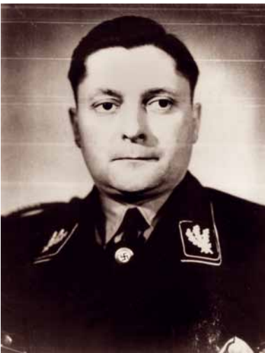
(BArch, BDC/SSO, Kaufmann, Karl, 10.10.1900)

Karl Kaufmann, geboren 1900 in Krefeld, trat 1922 in die NSDAP ein. 1929 wurde er Leiter des NSDAP-Gaus Hamburg. Am 16. Mai 1933 stieg er zum Reichsstatthalter, dem Vertreter der Reichsregierung in Hamburg, auf und konnte bald die wichtigsten politischen Ämter der Stadt auf sich vereinen. Kaufmann gehörte zu den Hauptorganisatoren der Verfolgung politischer Gegner und Gegnerinnen. Er sorgte dafür, dass ihm ergebene Männer Schlüsselpositionen innerhalb der Justiz und Polizei erhielten. SA-, SS- und Stahlhelm-Angehörige wurden als „Hilfspolizisten“ bei der Jagd nach Oppositionellen eingesetzt. Kaufmann veranlasste die Aufstellung des „Kommandos zur besonderen Verwendung“ („KzbV“) der Polizei im März 1933, das mit brutalen Methoden Verhaftungen durchführte, sowie die Einrichtung des KZ Fuhlsbüttel. In seinem Auftrag wurden Gewaltverbrechen begangen, die Spuren dieser Verbrechen beseitigt und die Täter vor möglicher Strafverfolgung geschützt. Nach Kriegsende war er bis 1948 in britischer Internierungshaft, musste sich jedoch nicht vor Gericht verantworten. Ende der 1950er-Jahre war er leitender Mitarbeiter im Versicherungsunternehmen eines ehemaligen Parteigenossen. Karl Kaufmann starb am 4. Dezember 1969 in Hamburg.