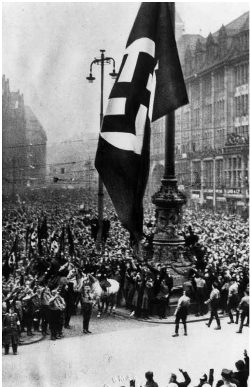
Hissen der Hakenkreuzfahne auf dem Hamburger Rathausmarkt am 8. März 1933.

Foto: unbekannt. (StA HH, Pl 221-1933.12)