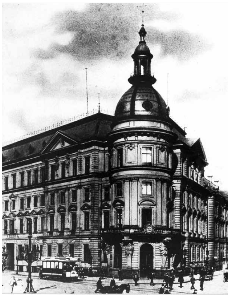
Das Stadthaus, Sitz der Gestapo und des „Kommandos zur besonderen Verwendung“, zu Beginn des 20. Jahrhunderts.