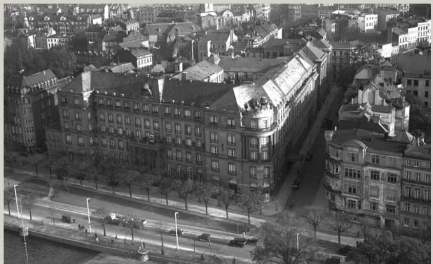
Das Hotel „Atlantic“ an der Alster, 1930.